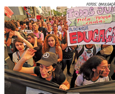
Greve na educação

Professores de todo o país deverão paralisar as atividades em 13 de agosto contra os retrocessos das políticas do governo de Jair Bolsonaro.